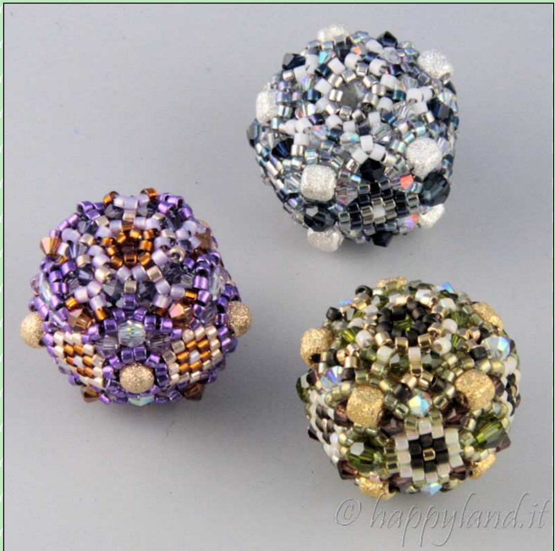
Schéma n. BL54